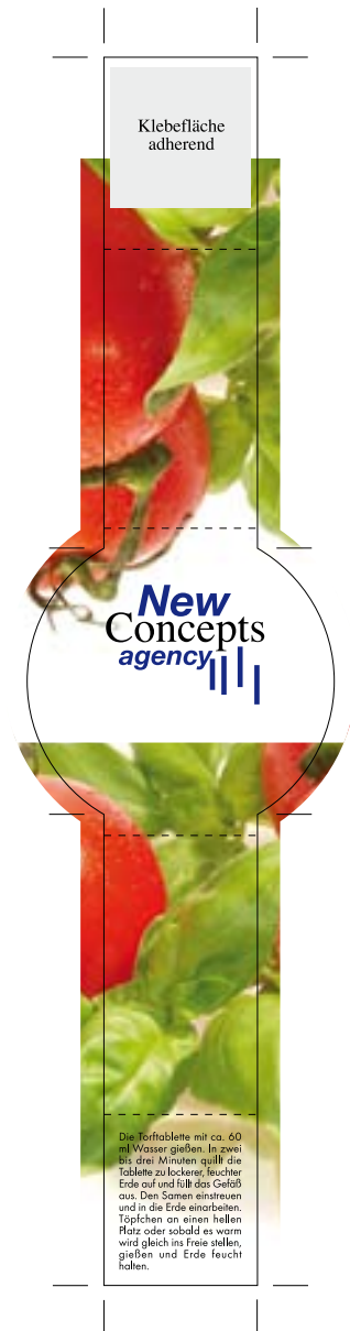
Gestaltete Standzeichnung designed stand drawing

You will receive a proof for approval. Please check this carefully for text, motif, position and colours.